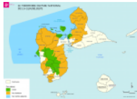
Limites du Parc national de la Guadeloupe Carte PNG n° 14200609